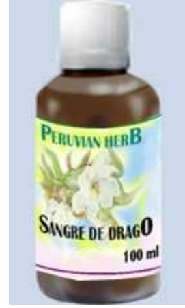
Croton lechleri (Sangre de drago)